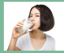
ผู้บริโภค