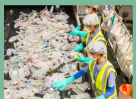
โรงงานรีไซเคิลพลาสติก