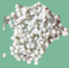
เม็ดพลาสติก HDPE