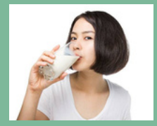
ผู้บริโภค