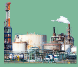
โรงงานเคมี