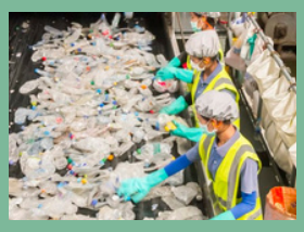
โรงงานรีไซเคิลพลาสติก