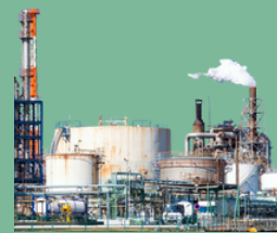
โรงงานเคมี