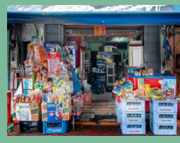
ร้านค้าปลีก