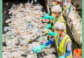
โรงงานรีไซเคิลพลาสติก