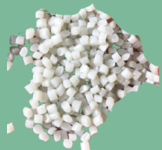
เม็ดพลาสติก HDPE