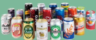
กระป๋องเครื่องดื่ม