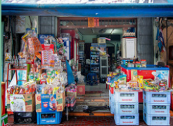
ร้านค้าปลีก