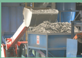
โรงงานหล่ออะลูมิเนียม