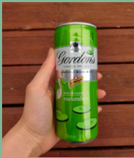
ผู้บริโภค