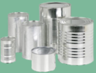
กระป๋องอะลูมิเนียม