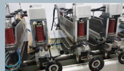
โรงงานผลิตฟิล์มพลาสติกชนิดต่างๆเพื่อ นำมาขึ้นรูปเป็นแผ่นและซอง ตามชนิดของอาหาร