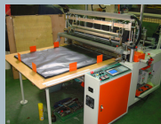
โรงงานบรรจุภัณฑ์