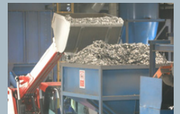
โรงงานรีไซเคิลพลาสติกชนิดต่างๆ เช่น M-PET, PET, PP