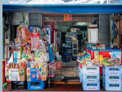
ร้านค้าปลีก